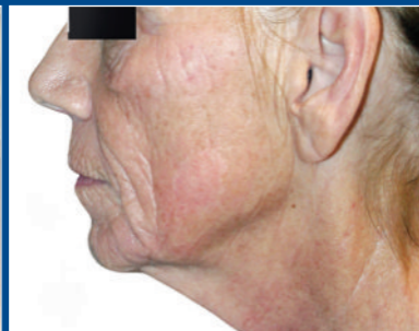
Resultados después de 7 tratamientos.