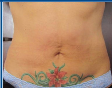
Resultados después de 3 tratamientos.