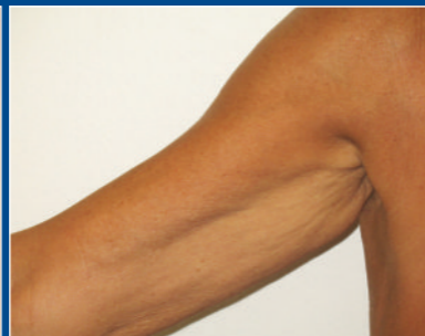
Resultado después de 6 tratamientos.